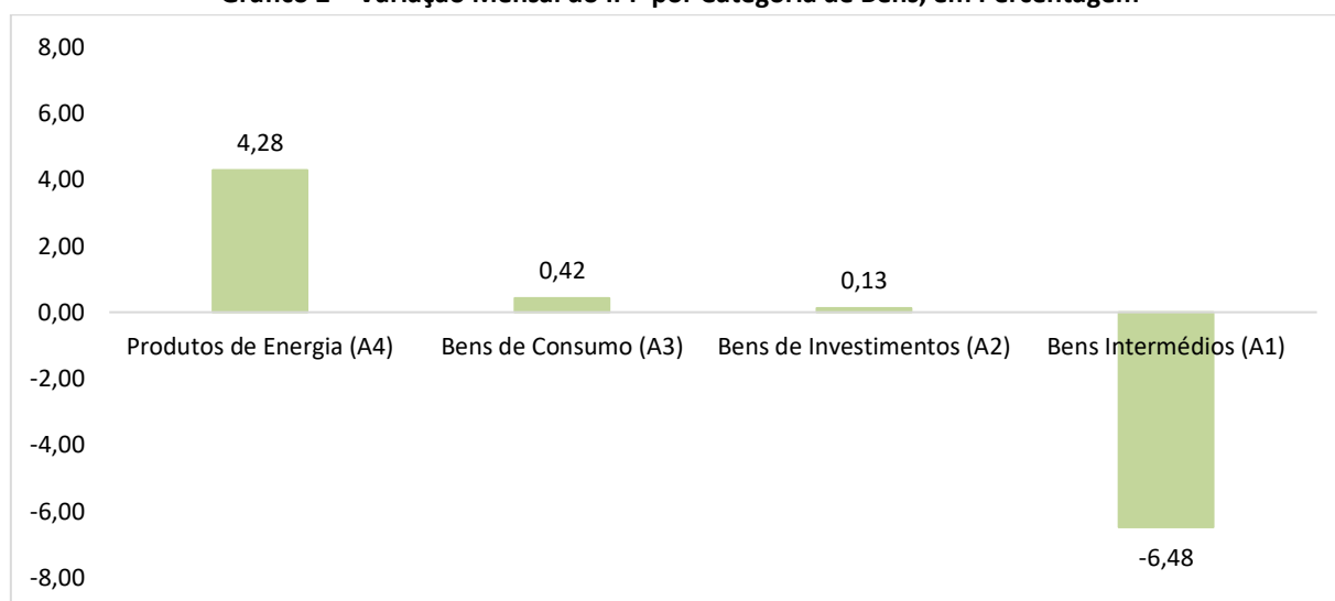
Gráfico 2 – Variação Mensal do IPP por Categoria de Bens, em Percentagem

Comparativamente ao período homólogo, os preços de “Bens de Investimento” variaram em 6,25%, correspondendo a um aumento de 0,71 ponto percentual; os “Bens de Consumo” variaram em 3,94%, traduzindo uma desaceleração de 1,60 pontos percentuais; os “Produtos de Energia” registaram uma variação de 0,03%, representando uma redução de 4,99 pontos percentuais; e os “Bens Intermédios” apresentaram uma variação de negativa de 28,96%, o que corresponde a uma queda de 33,86 pontos percentuais, face ao mês de Fevereiro de 2025.